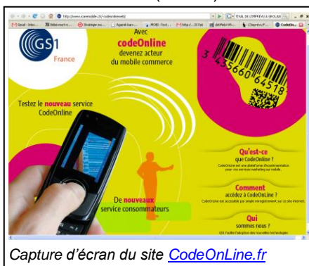
Capture d'écran du site CodeOnLine.fr

Depuis le 16 Septembre, GS1 France propose un nouveau service à ses adhérents : CodeOnline. Il s'agit d'une plateforme technique destinée à faciliter l'expérimentation de services mobiles basés sur les standards GS1. Le site Internet CodeOneLine reprend les grands principes de fonctionnement et permet le téléchargement du lecteur de code à barres (1D/2D).