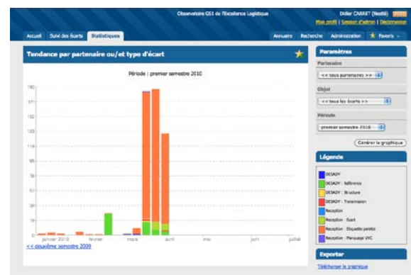
► Module statistique : évolution du pourcentage de commandes en anomalie, répartition des anomalies par type d'écart.