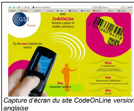
Capture d'écran du site CodeOnLine version anglaise

CodeOnLine est de fait une initiative de dimension internationale car les standards et l'infrastructure technique utilisés sont déjà interoperables dans 80 pays. Les organisations GS1 à travers le monde vont maintenant s'inscrire dans ce processus de nature à accélérer l'adoption du Mobile Commerce. Ainsi, plusieurs pays ont déjà confirmé leur volonté de proposer à leurs adhérents une version locale de CodeOnLine . Cette dynamique réaffirme la nécessité de repositionner dans l'écosystème les standards GS1.